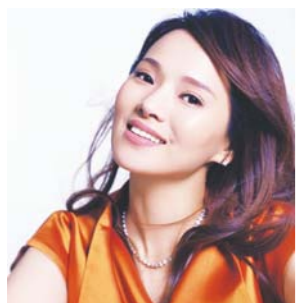
□ 本报记者 陈巨慧