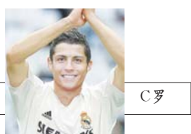
□ 本报记者 王磊

前一刻出场的梅西刚刚用世界波缩小了射手榜上与C罗的差距,后一刻登场的C罗马上就头球破门再次将差距拉回到四球。