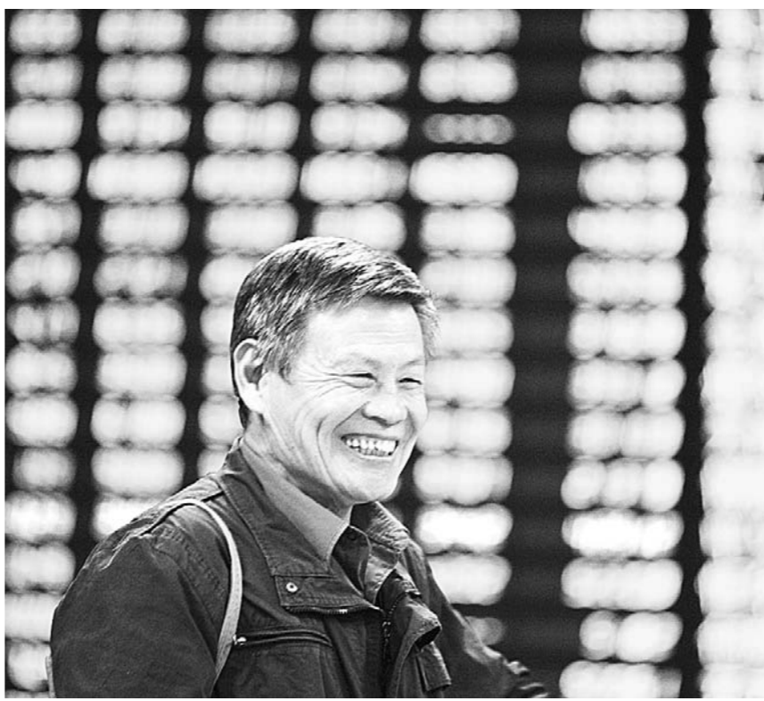
4月7日, 证券营业部的股民。