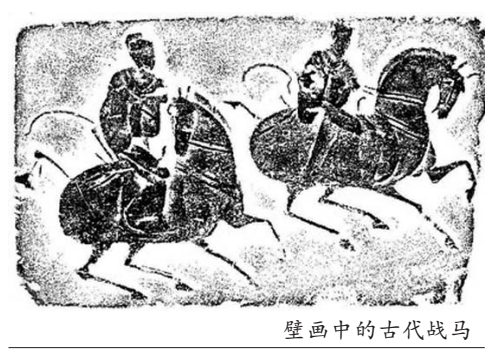
壁画中的古代战马

同时设千乘县，县城的遗址在高青县唐坊镇卢家村。当时漯水正从千乘郡和千乘县的两城之间穿过，形成了两城隔水相望的格局。所