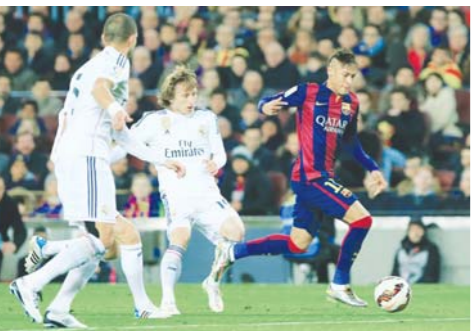
巴塞罗那队球员内马尔(右)在比赛中突破。