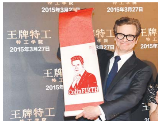
3月23日，演员科林·费尔斯在北京举行的影片《王牌特工：特工学院》首映礼上展示中国粉丝赠送给他的礼物。

在人物叙事方面，影片开头重复出现了“坚强而勇敢，仁慈而善良”，这并不是累赘，反而展现出瑞拉内心不断成长、慢慢成熟的过程。由凯特·布兰切特扮演的邪恶继母一举动，将小人物的唯利是图和恶毒展现得淋漓尽致。同时，海伦娜饰演的女巫则属于生动活泼、滑稽幽默的角色。二者对比，相得益彰。尽管剧中出现了老鼠、兔子等经典卡通动漫形象，但导演在处理时，并没有像以往动漫形象夸大其表现能力，而是中规中矩地展现，反而更像一部爱情片。