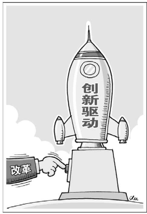
点火 新华社发 徐骏 作

为了激励成果转化,意见提出要提高科研人员成果转化收益比例,对于奖励科研负责人、骨干技术人员等重要贡献人员和团队的收益比例,可以从现行不低于20%提高到不低于50%。同时,鼓励各类企业通过股权、期权、分红等激励方式,调动科研人员创新积极性。高新技术企业和科技型中小企业科研人员通过科技成果转化取得股权激励收入时,原则上在5年内分期缴纳个人所得税。