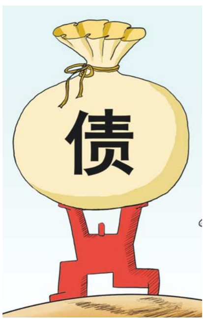
按照审计署截至2013年6月的审计结果，地方政府2015年到期需偿债1.86万亿元，这还不算在此之后新增的地方短期债务。