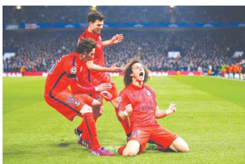
▲巴黎圣日耳曼队球员庆祝进球