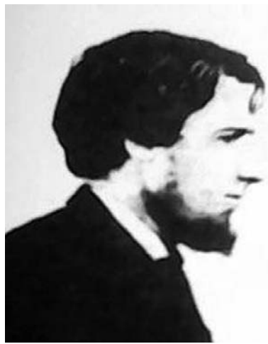
▲第一位将西药引到青州的李提摩太

清光绪八年(1882年)，外科医生迪克逊在青州城里租赁房屋设立“教会施医所”，以传教为前提，行医、卖药，每星期两次免费发放药品，传播西医西药知识，宣传教义理念。