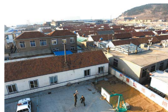
岛上最盛大的娱乐活动就是来一次双人篮球比赛，因为一次很难凑够足够人数。