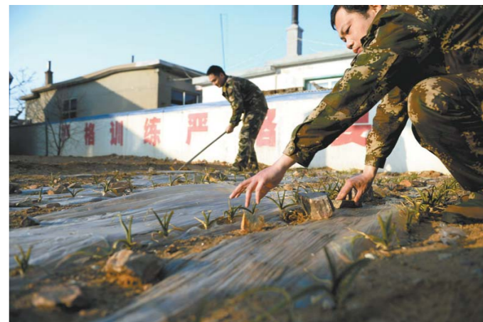
所里小菜地里的土都是从岛外背回来的，尽管菜不怎么长，但他们依然非常珍惜每一棵青苗。