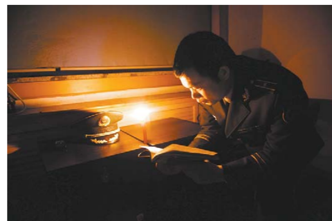
其实停电和有电对于业余生活来说没有太大区别，反正岛上也没地方去消遣。