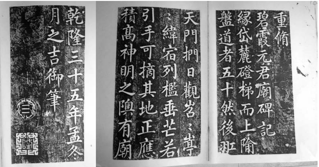
乾隆帝重修碧霞元君庙记原拓