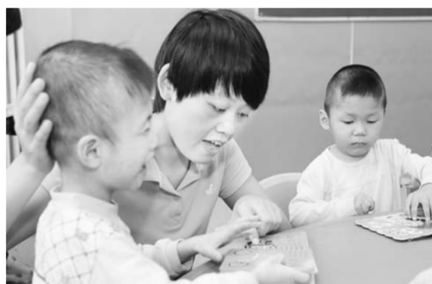
△在福彩公益金资助建设的德州市儿童福利院中,孩子们享受幸福生活

彩票总销量位居全国第二位。 山东福彩在高位运行下实现持续增长,必须加强公益品牌建设,弘扬福彩文化,这已成为全省福彩系统的共识。省及各市中心积极开展以“扶老、助残、救孤、济困”为重点的公益活动,抓住社会热点事件,不失时机地开展福彩助学、福彩助劳模、福彩走进社区、福彩救助困难家庭等一系列救助活动。如省中心与团省委青少年发展基金会联合举办“‘爱与希望同行——我爱阅读’福彩图书走进希望小学”活动,青岛持续开展为老人查体、济南开展“百千助学”等。这些活动受到了社会好评,进一步巩固和提升了福彩的良好形象。 (钟欣)