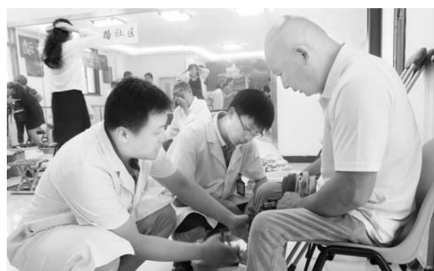
△“齐鲁福彩助残行动”走进青岛