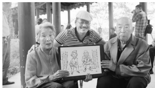
△庆“重阳”济南福彩携手漫画家共绘敬老情,为敬老院的老人送上节日的祝福