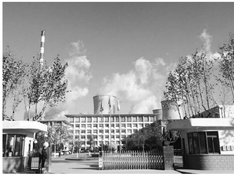
△经过治理,重点企业大气污染物排放浓度大大降低