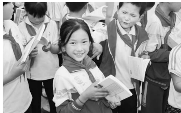
△“爱与希望同行——我爱阅读”福彩图书走进希望小学