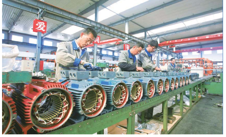
△山东力久电机有限公司