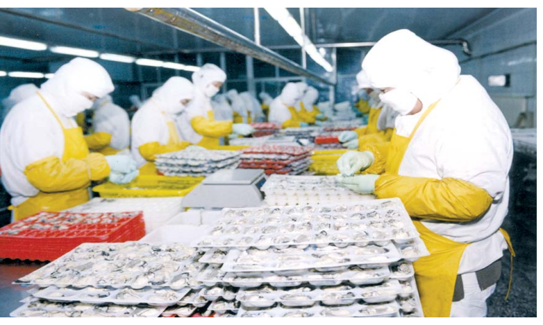
△乳山正洋食品有限公司

探索上市融资、专项扶持基金、林权抵押等多元融资模式，促进景区开发。其中，金牛谷景区通过林权抵押方式融资2100万元。 乳山积极打造智慧旅游，利用网络、微信、微博等新兴媒体，在全省率先开通旅游网络信息平台和智能手机旅游客户端系统后，开通了旅游官方微博公共账号，通过文字、视频、图片、语言等方式，及时发布旅游资讯和游玩推荐，为游客第一时间提供便利的旅游服务。 乳山引导域内景区开展了“一元游景区”、免费游景区、电子抢票等“微营销”活动，实现了景区知名度和经济效益的双赢。 去年，乳山接待国内外游客813.3万人，实现旅游综合收入48亿元，分别增长15%和18%。