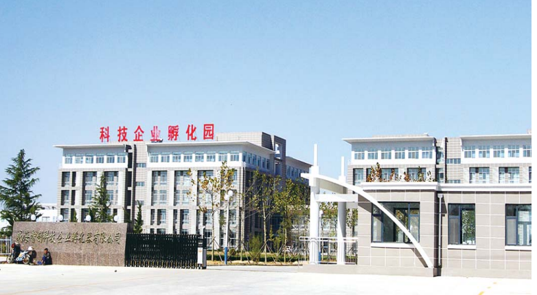
△威海海智创科技企业孵化器有限公司

乳山积极掘金“银发经济”，出台了《关于加快发展健康养老产业的意见》，建立了健康养老十大产业体系，将健康养生产业打造成新常态下新增长点，奋力打造健康养老服务先行区。 依托优美的自然环境、银滩房产优势，顺应老龄需求，乳山提出“转型养老”的理念，设立居家养老服务中心，为社区居家养老提供生活照料、康复护理、上门送餐等服务；在城市社区设立日间照料中心，引导银滩新建和在建楼盘房产开发企业融入养老元素，推进农村互助幸福院建设；引导更多主体参与社会养老事业，新建老年人养护中心和幸福苑老年公寓；加强本地医疗机构与区域内养老养老机构合作，积极引进高端医疗卫生机构提供专业化的医疗保健养老服务；利用银滩已出售的闲置房产，引导企业引进养老养老机构整体返租、统一改造楼盘，与专业酒店管理公司、健康管理公司和物业服务公司联合经营，挖掘房产二次利用价值，并通过养老养老机构与其在全国各地养老基地、合作机构进行客源互送，打造异地互动养老。 目前，乳山已初步形成了居家养老、社区