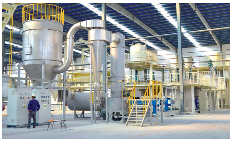
△威海海恒德新材料有限公司

农产品质量安全管理工作，乳山走在全国前列，并一直致力于再突破。在全国率先实施农产品安全区域化管理，消除出口和内销“双重标准”，建立农产品可追溯体系的基础上，去年，乳山又投资300万元在全市600多家基层农资店安装“农资一卡通”电子监管设备，成为全国首家实施农资监管的县。该设备包含农资销售采集、进货采集、库存管理、经营分析、货源追溯等功能，并与市级监管平台联网，可以对投入产品销售情况进行动态监管，从源头上杜绝违禁药品使用，将农产品产前、产中、产后各环节纳入标准生产和管理。 严格的监管，为“乳山产”农产品贴上了“安全、健康、养生”的标签。目前，乳山农业标准化基地达50余万亩，绿色、无公害、有机食品认证98个，拥有牡蛎、茶叶、生姜、苹果、蓝莓等9个国家地理标志产品。