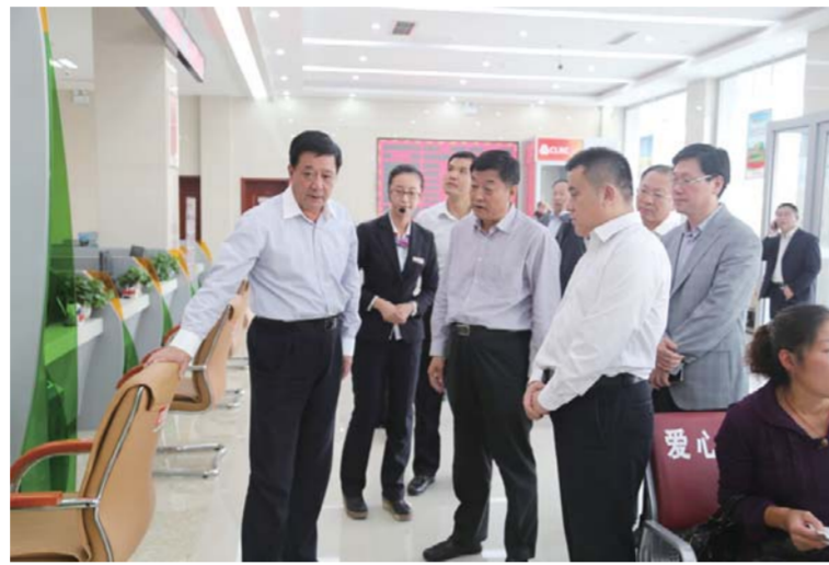
△省联社理事长、党委书记张建民(左四)到基层调研网点转型工作

党的十八届三中全会吹响全面深化改革的集结号，作为地方金融机构，山东省农村信用社、农村商业银行、农村合作银行紧跟铿锵的改革鼓点，发动创新的马达，迈开转型发展的步伐，七万名农信人用勤劳和汗水交出一份亮丽的改革发展成绩单。