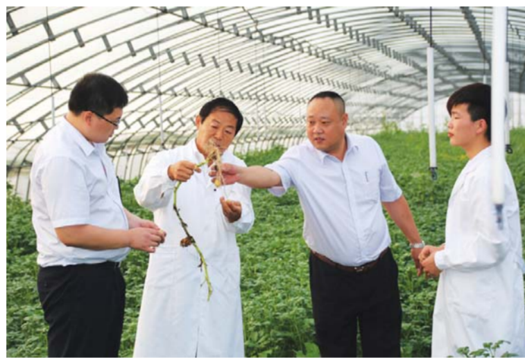
△客户经理在马铃薯原种繁育基地了解情况