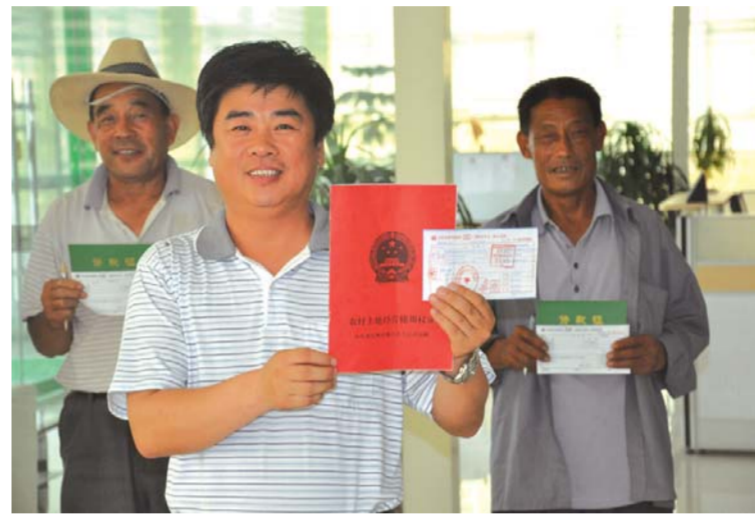
△创新推出土地经营权抵押贷款，客户由此获得80万元贷款