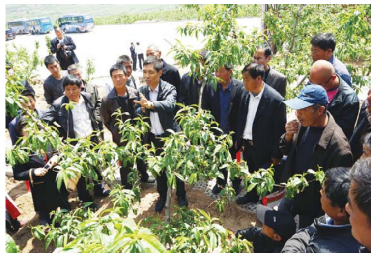
△“服务三农圆梦行动”把农业科技知识送到田间地头