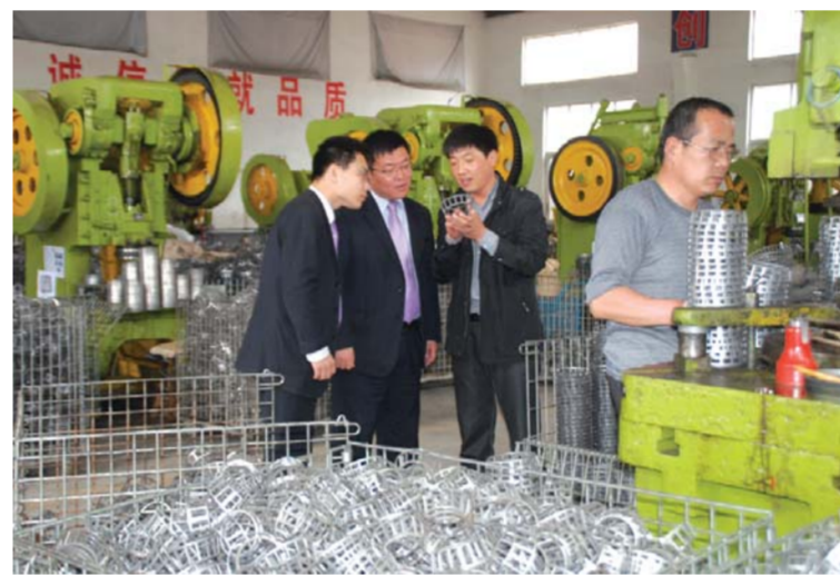
△客户经理深入企业进行贷前调查