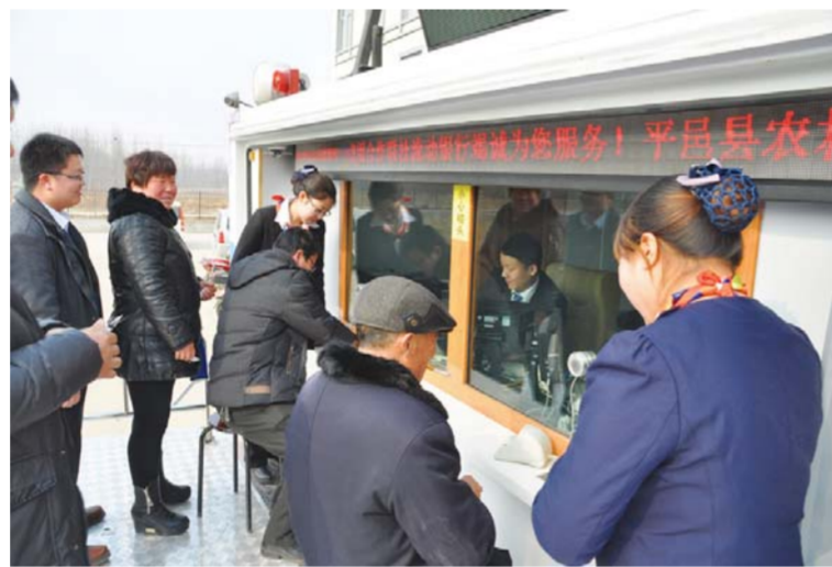
△流动银行提供贴心服务