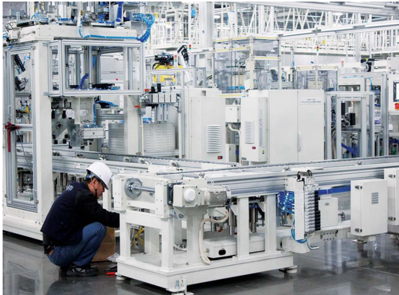
△新建成的山东现代威亚汽车发动机有限公司发动机四工厂正在调试设备

据统计，2014年该区仅项目推进服务中心就为企业解决大大小小难题近百件。一系列接地气的暖心服务赢得了投资者们的充分信赖和支持，也让项目推进顺风顺水。