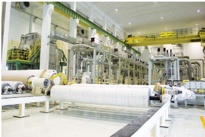
△新建投产的亚太森博(山东)浆纸有限公司液体包装纸板项目生产线