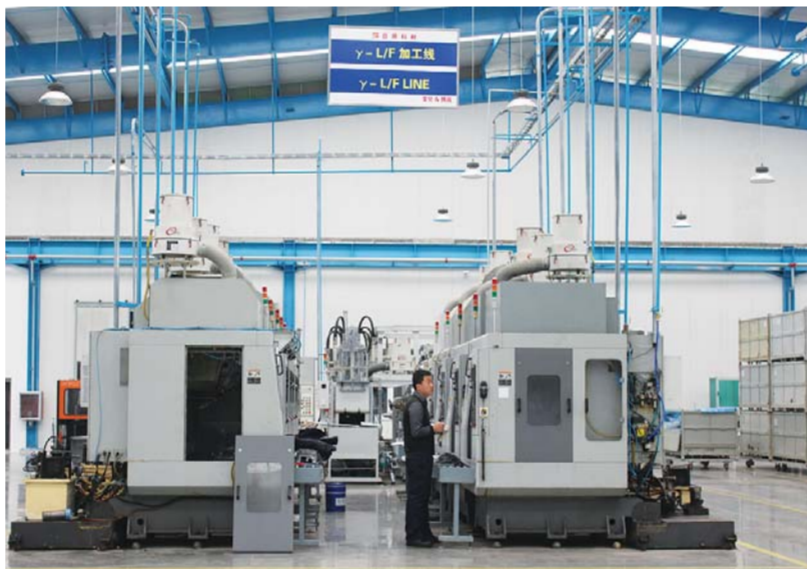
△日照科耐汽车部件有限公司新车间