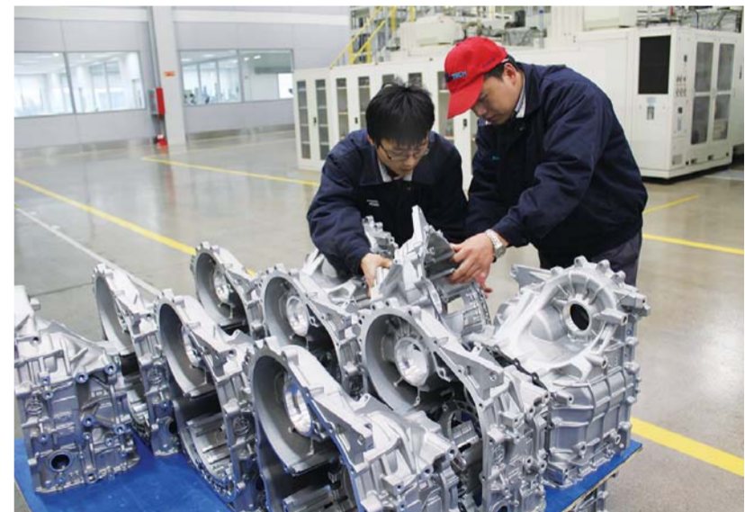
△现代派沃泰自动变速箱(山东)有限公司工作人员检测新产品