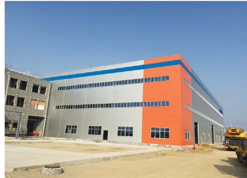
△现晟(山东)汽车冲压模具有限公司新厂房