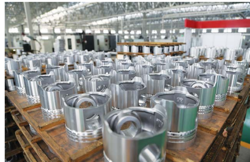
△山东双港活塞股份有限公司新工厂内码放整齐的新产品