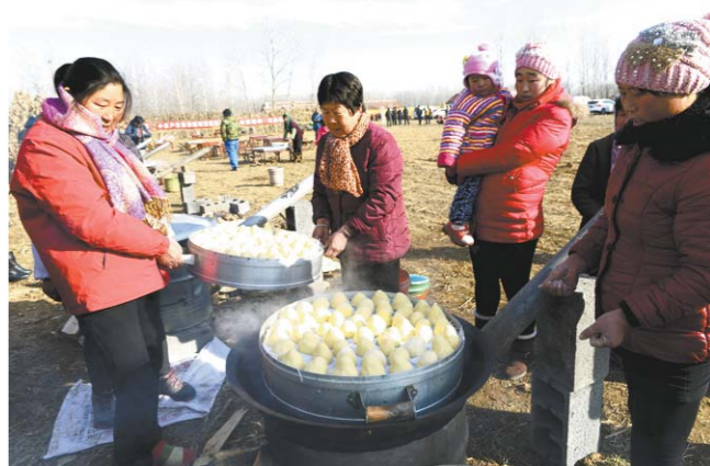
村民支起大锅蒸窝头，让来自城里的市民们品尝。