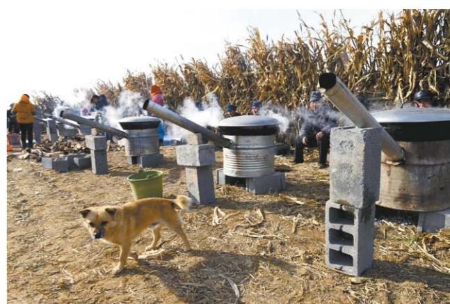
村民用大锅煮肉款待四方来客。