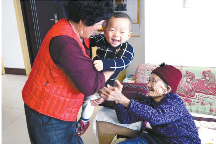
尽管人已糊涂，但老人对家人、对晚辈有着本能的愛。