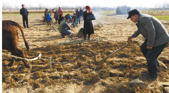
一位市民在体验黄牛耕地。