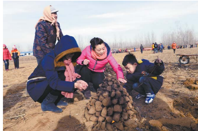
市民体验“火龙焖地瓜”的乐趣。