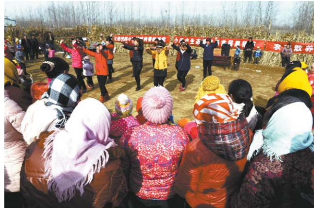
村民载歌载舞庆祝趣味农民运动会成功举办。