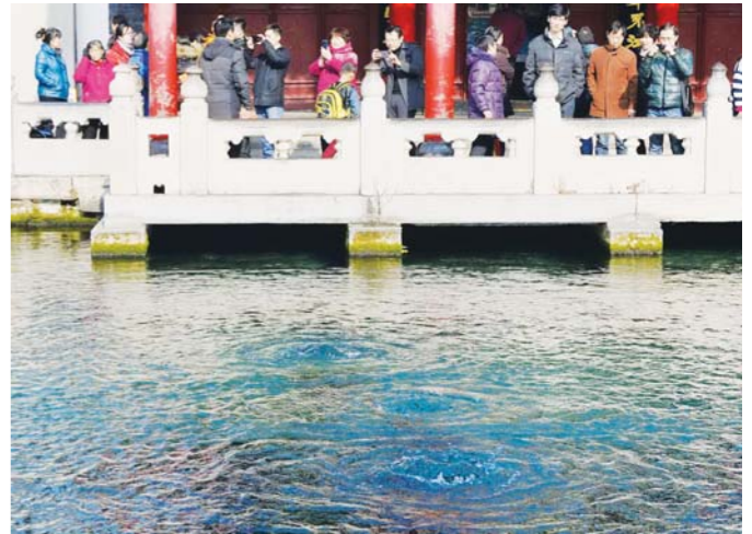
□记者 房贤刚 报道 1月10日,游客在济南趵突泉公园观看泉水,拍照留念。

□记者 晁明春 报道 本报济南1月10日讯 “虽然趵突泉还在喷涌,但劲头却明显不足了,无精打采的,有点让人担忧呢。”今天,济南趵突泉边,来自北京的郑先生在自拍了一张和泉水的合影之后,不担心地表示。不远处天尺亭上的地下水位表上,27.88米的数字也验证了这样的担心不无道理——与2014年1月10日当天的28.75米相比,相差87厘米。虽然相比1月9日27.84米的数字,今天的地下水位出现小幅反弹,但已经连续28天失守28米的橙色预警线,正逼近27.6米的红色警戒线。自2014年12月14日,趵突泉水位达到27.99米,一年中第5次跌破28米的橙色警戒线以来,基本失去了向上跃升的势头。这也是自2003年9月6日在地下水位上升到27.01米时恢复喷涌,至今已持续喷涌11年的趵突泉,遭遇了最大的危机。“春节后济南泉水将迎来最大的一道坎——春灌。如果再没有有效降水,春灌期间水位会有0.50米左右的降幅,到时离停喷线就真的不远了。”家住趵突泉附近,每天都要到公园看一看的一位老人说道。对济南市来说,2014年是个少有的旱年,全市平均降水量为430.7毫米,较历年同期少203.6毫米,较上年同期少291.8毫米。