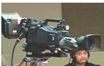
大众日报记者 今天将在多地连线直播