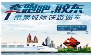
大型网络专题:奔跑吧,胶东 http://www.dzwww.com/2014/qrtl/