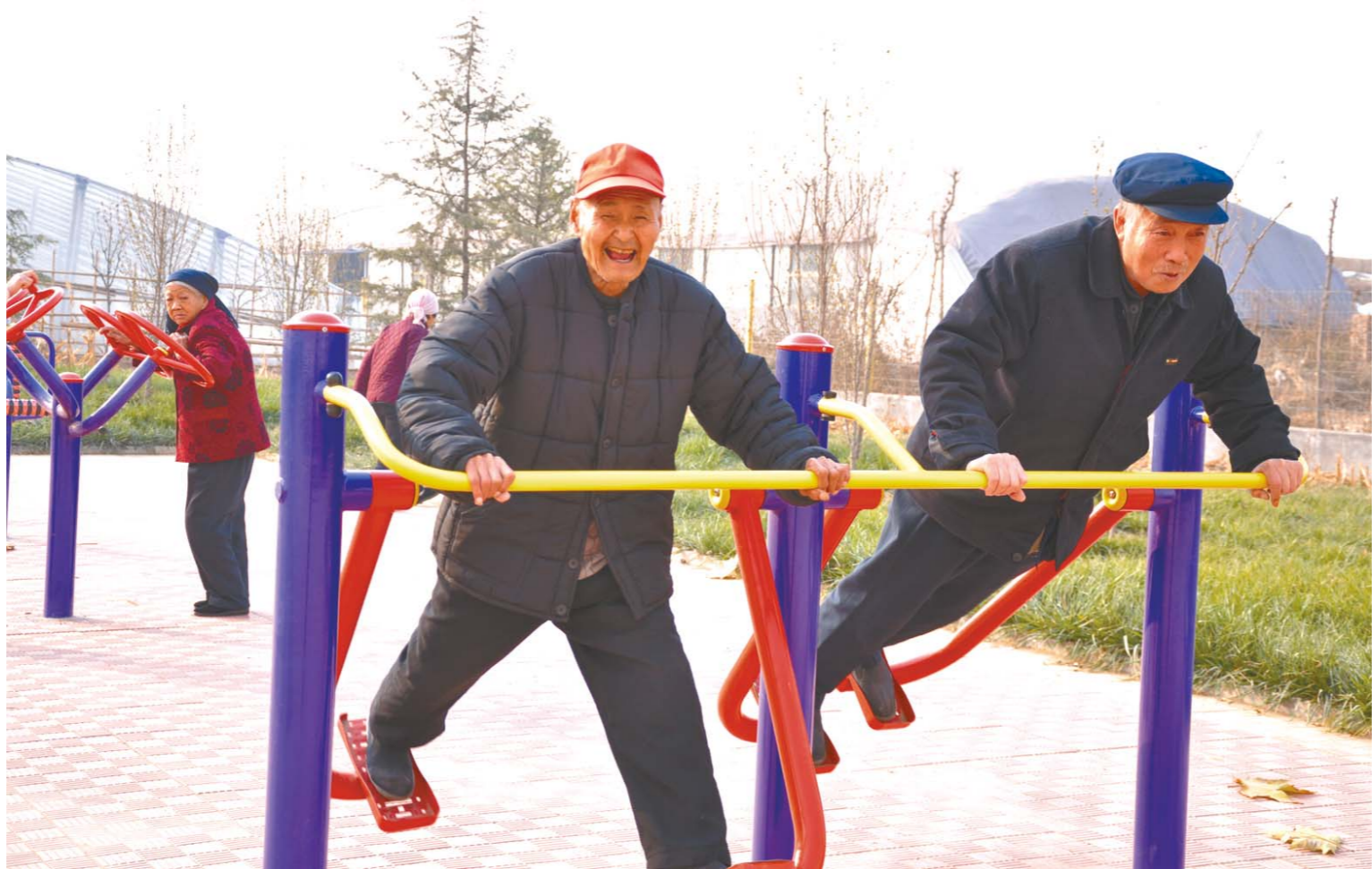
□石如宽 报道 寿光市社会福利中心院内，老人们在健身。