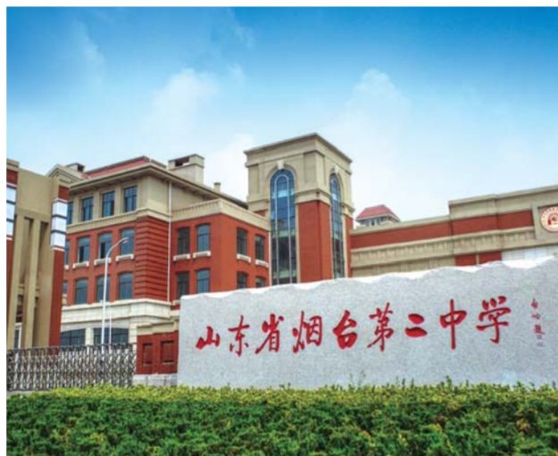
△烟台二中高新区校区