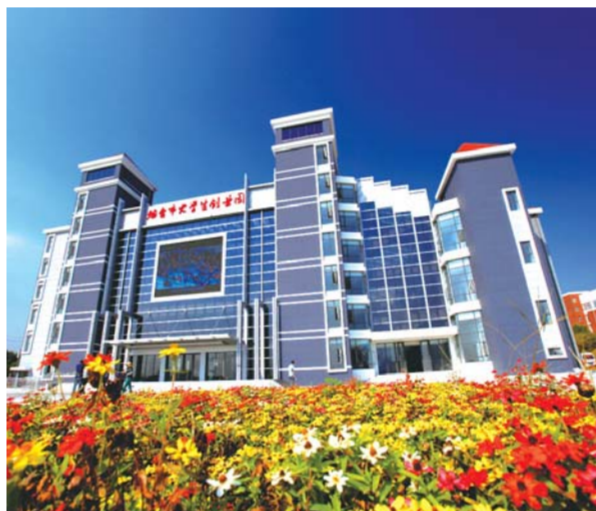
△烟台市大学生创业园