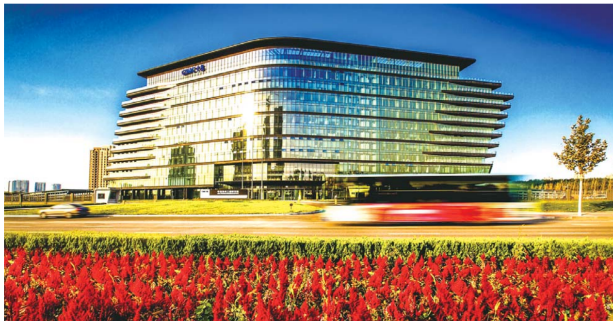
△中集海洋工程研究院