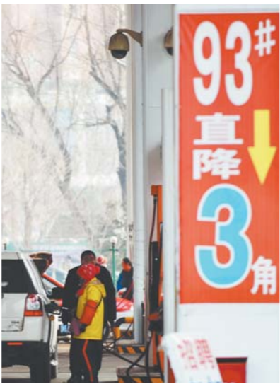
△12日，沈阳一家民营加油站打出93号汽油降3角的宣传牌。

今年4月，日本消费税率从5%提升到8%。11月，日本首相安倍晋三宣布将提前举行大选，同时推迟实施原定明年10月将消费税率提升到10%的计划。与消费税相关话题成为舆论热点。去年日本的年度汉字是“轮”，以庆祝首都东京赢得2020年夏季奥林匹克运动会主办权。