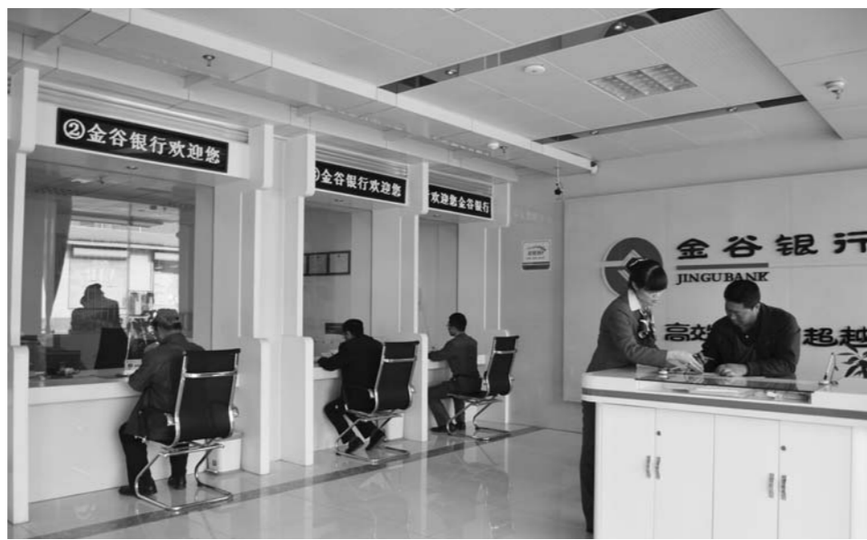
金谷村镇行夏庄支行员工在为储户提供服务。

“今年各种农产品价格不高，多数企业的效益也一般，但是居民存款却增长迅速，这说明镇区的人口在快速增加。”王海荣分析说。据了解，离镇区五分钟车程的石屯社区正式入住后的一年内，当地一家银行代办员的储