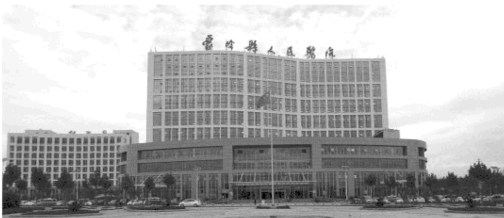
△蒙阴县人民医院主体大楼

六十年一甲子，弹指一挥间。我们无法一一细数，也无法探究明白，这所造福百姓的医院到底经历了多少风雨兼程，再回首，最开始的那家借用三间民房开诊的卫生所如今已俨然成为集医疗、教学、科研、急救、预防、保