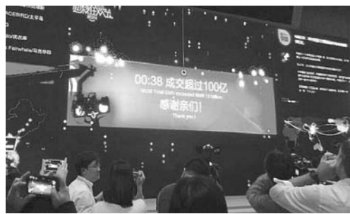
△天猫双11购物狂欢节现场直播大屏上的交易数字急速滚动，38分钟突破100亿元。