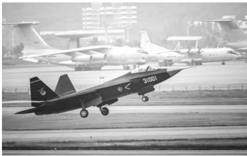
△11月10日，参加第十届中国航展的歼-31战斗机在珠海航展中心上空试飞。