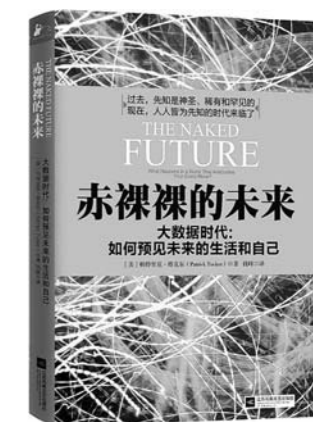
《赤裸裸的未来》 【美】帕特里克·塔克尔 著 江苏凤凰文艺出版社

作者用细腻的笔触娓娓描绘一个个关于生活、关于爱情、关于情调、关于植物的印象，用女性特有的唯美和浪漫，对这些唯美的事物做了细致动人的诠释。