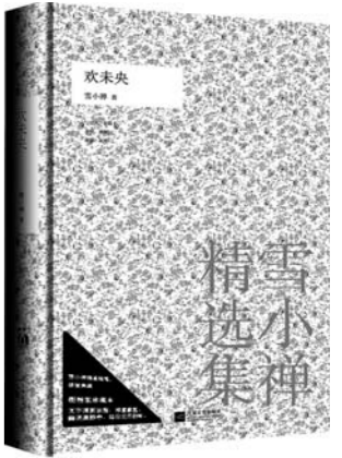
《欢未央》 雪小禅 著 江苏文艺出版社

一个对东方古老文明深有研究的心理医生，仅仅在女病人的眼睛下方轻敲几下，她的焦虑、不安和头痛就消失得无影无踪。这件神奇的事情很快传遍了欧美，人们纷纷造访，甚至愿意花天价求购这个神秘的疗法……情绪释放疗法带来革命性无压力生活体系。