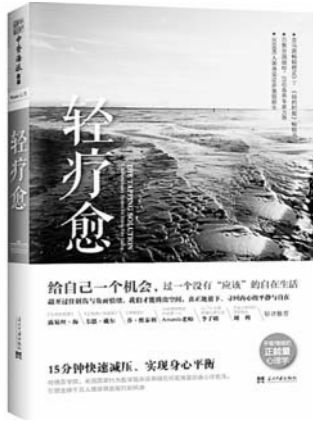
《轻疗愈》 【美】尼克·奥特纳 著 当代中国出版社

一个对东方古老文明深有研究的心理医生，仅仅在女病人的眼睛下方轻敲几下，她的焦虑、不安和头痛就消失得无影无踪。这件神奇的事情很快传遍了欧美，人们纷纷造访，甚至愿意花天价求购这个神秘的疗法……情绪释放疗法带来革命性无压力生活体系。