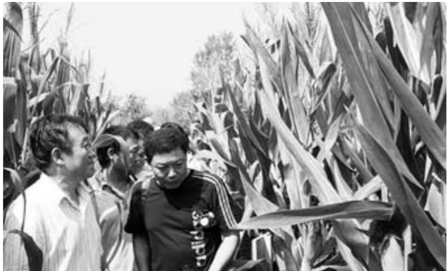
9月5日,部分种企负责人、销售大户等参加菏泽玉米新品种观摩会。(资料片)

另外,我省将加强基础性公益性研究和种子基地建设。省财政科研经费用于基础性公益性研究的比重将会加大,而用于农业科研院所和高等院校开展杂交玉米、杂交棉花和蔬菜商业化育种的投入,将逐步减少。省财政还将投资并吸引社会资金共同设立现代种业发展基金,支持种子企业提升自主创新能力。 王登启说,2020年,我省力争培育15家在国内外具有较强竞争力的“育繁推一体化”种子企业。建设30个小麦、玉米、棉花、花生、蔬菜、果茶、林木等商业化育种(苗)中心。