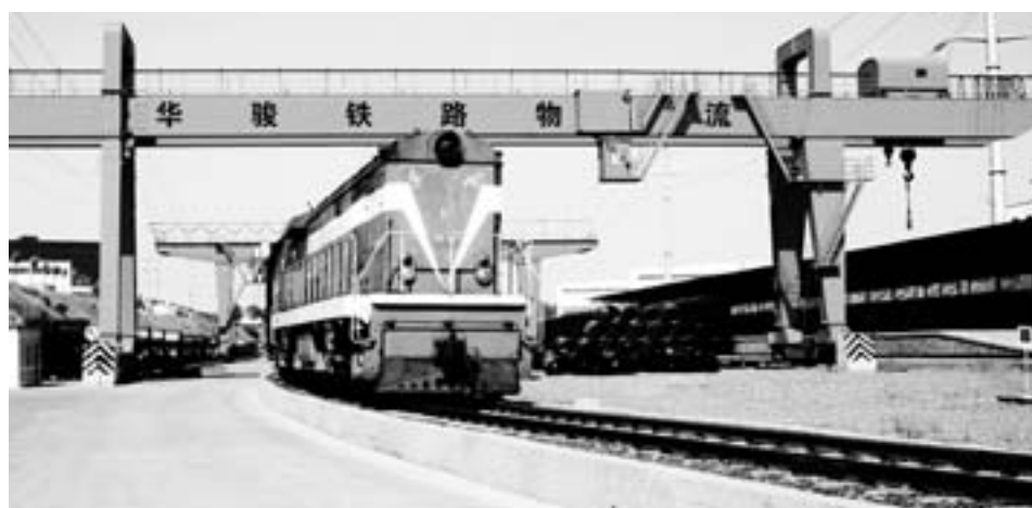
▲自建的两条2.6公里长的铁路专用线，是华骏物流园的优势条件。 □王新蕾 报道

未来几年，华骏物流园将构建大宗产品物流园、铁路物流园、电商物流园、城市共同配送物流园、保税物流园、公路港物流园的“一区六园”模式。