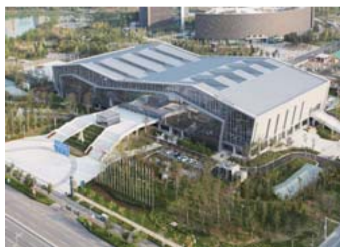
△综合体育中心，是省运会比赛场馆，主要包括体育场馆、会展中心、地下超市和地下车库，可以满足国内外重大体育比赛、全民健身活动、国际技术博览的需要。