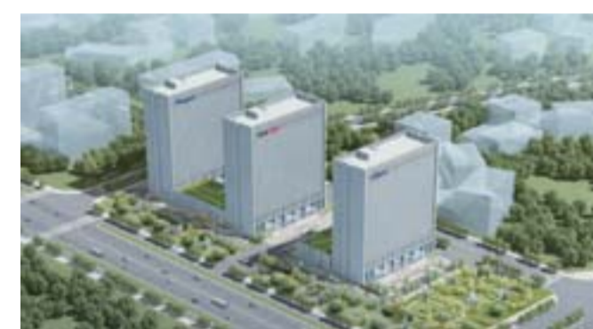
△财富中心，是济宁高新区重点打造的区域性科技金融中心，这里聚集了一大批股权投资、证券、银行、担保、保险、财务公司、资本中心等企业，与科技企业展开密切互动。

建成代表济宁形象的科技新城，是市委、市政府着眼于全市经济社会发展全局和高新区长远发展，作出的一项重大战略决策。金秋时节，在科技新城核心区，一大批功能性支撑项目全面展开，济宁孔子国际学校、科技馆、图书馆、综合体育中心、创意大厦等建成投入使用，大学科技园、财富中心、印象吟龙湾、高新区人民医院等项目全速建设，城市功能日趋完善，科研、商务、金融、教育、文化、医疗、居住、社交、休闲等功能复合性越来越高，一座集创新之城、高新之城、生态之城、创业之城、和谐之城“五位一体”的创新型国际化科技新城正加速崛起。