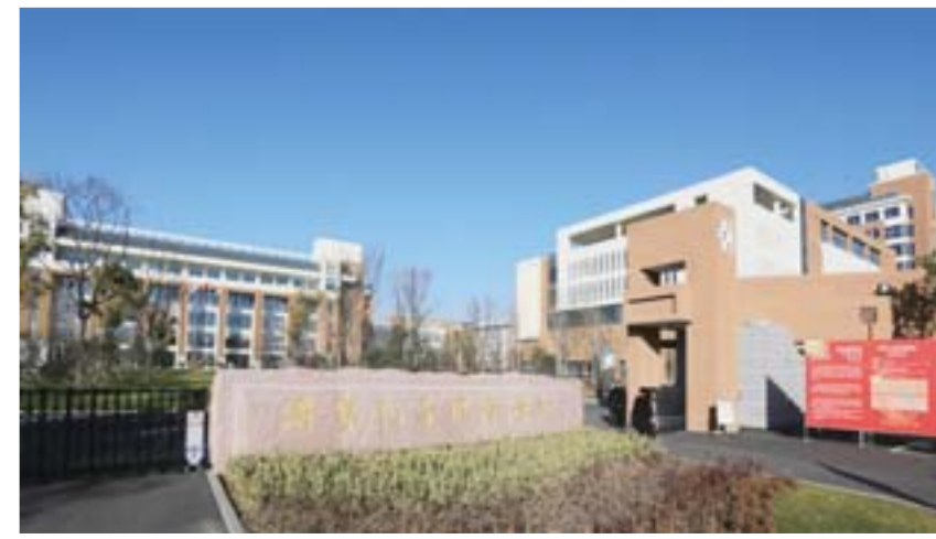
△济宁孔子国际学校，是科技新城实施特色教育的重要标志。学校全方位实施“双轨制”素质教育，以“国学底蕴、双语文化、艺术修养”为特色，提倡“学习、创造、享受”的理念，着力打造济宁高端教育品牌。