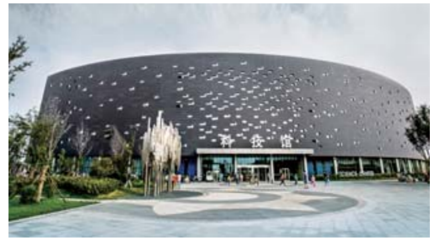
△科技馆，与图书馆、影视馆和商务馆共同组成济宁科技中心建筑群。在这里，公众通过亲身体验，激发对科学技术的兴趣，传播科学精神、思想、方法，增强探索和创新的能力，促进科学文化素质提高，备受广大市民热捧。