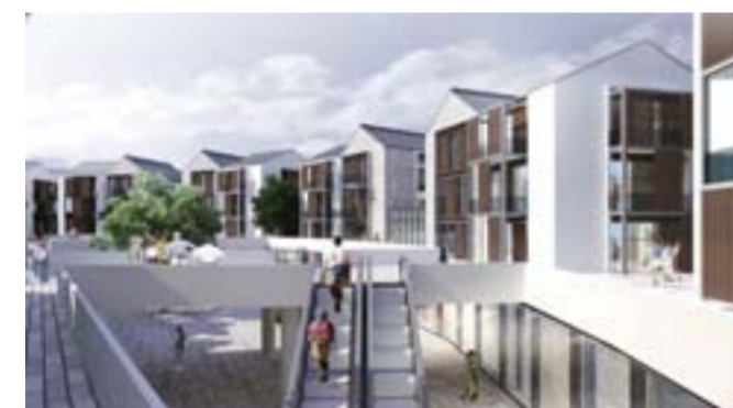
△印象吟龙湾，是一处集多种风格和现代生活业态的商业中心，代表着科技新城雅俗共融的生活品质。