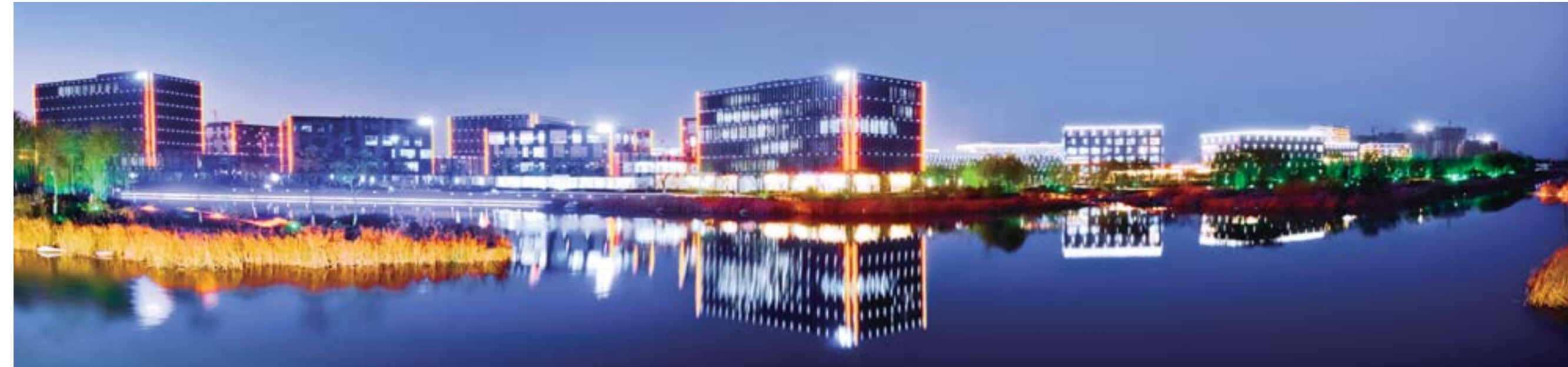
△产学研基地，是科技新城的标志性建筑组团，集前沿科技研发、高端创意孵化、行业认证检测、尖端人才培养、企业总部经济、重点高校院所、金融风险投资和综合配套服务于一体，已有50多家产学研合作平台、检测认证中心和孵化器云集于此。