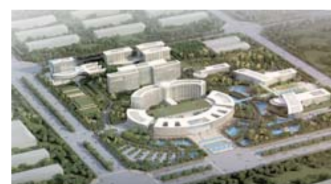
△高新区人民医院，由医疗、科研、教学、保健、康复等功能区组成，依托三级甲等医院实力，形成科技新城现代化、综合性的医疗康复中心。