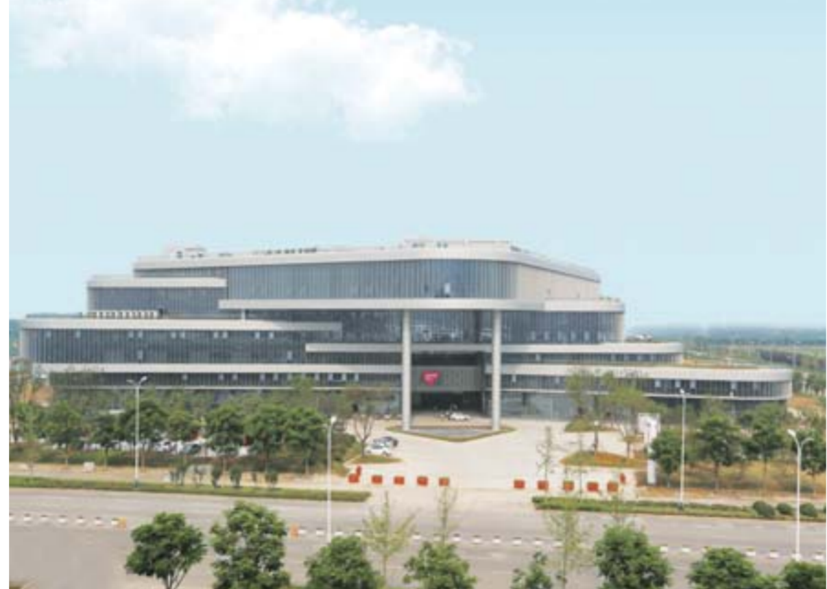
△创意大厦，是集工业设计、动漫制作、软件外包、文化艺术创意、建筑艺术设计于一体的创意产业孵化展示园区，已于7月底投入运营，吸引了美国甲骨文、豆神动漫、星火影视等60多家知名企业入驻，是一处助力“头脑风暴”的极佳场所。