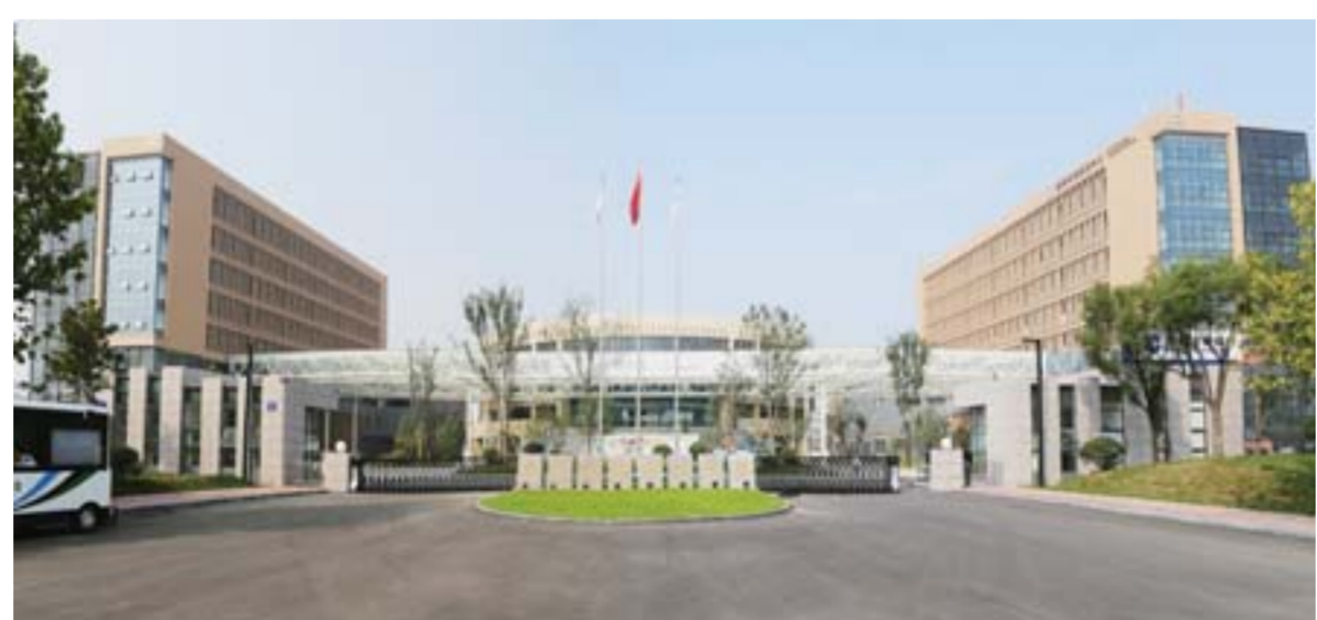
△大学园，是科技新城完善产学研基地功能、培养储备人才的重要支撑工程，可同时容纳6000名大学生在校就读。目前，济宁医学院、济宁学院14个专业2000名大学生及普惠实训基地大学生1000人已先期入住。这里背靠高新区数量众多的科技企业，可源源不断培养各类实用型技能人才。