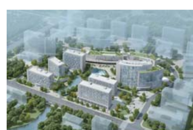
△大学科技园，是产学研基地5期项目，建筑面积16.3万平方米，主要为高等院校科技成果转化、高新技术企业孵化、创新创业人才培养、产学研结合提供支撑平台。