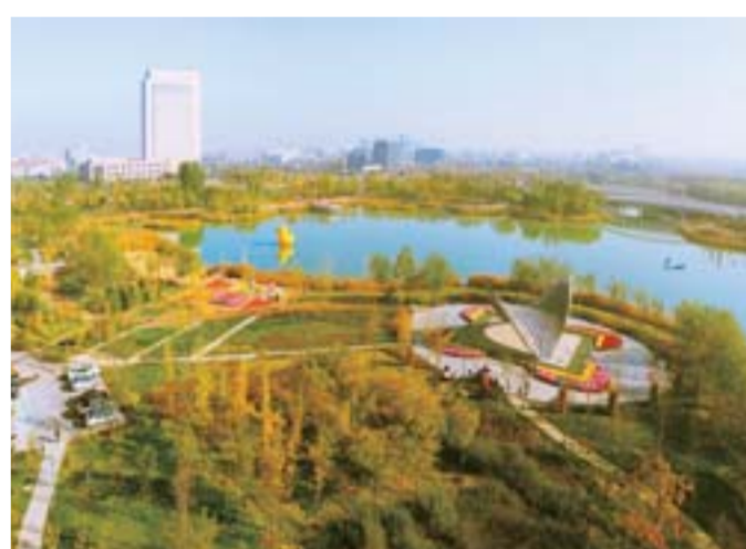
△蓼河公园，全长4.2公里，水面宽30-50米。公园以“叶之韵”、“蒲子的回忆”为设计主题，围绕水做文章，充分利用原有树林、水生植物等，以蒲草作为基调植物，形成了集湿地生态、园林景观、旅游休闲为一体的特色生态景观。整个公园以蓼河为主干，围绕吟龙湖、哆风湖布局了一系列科研、教育、休闲项目，是沟通生态与人文的纽带。