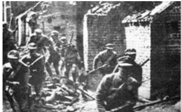
中国军队与日军在台儿庄城内激战。

1938年3月23日至4月7日的台儿庄大战,是全面抗战以来中国军队在正面战场取得的一次重大胜利,沉重打击了日军的猖狂气焰,极大地鼓舞了中国人民的抗战热情和胜利信心,提高了中国的国际威望。