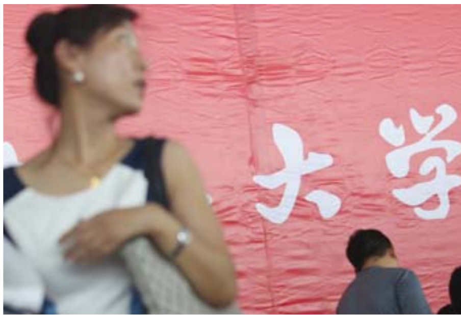
9月6日，山东省教育行政主管部门下发通知，明确“本科高校不得占用学校办学资源举办各类中等职业教育”。

而个别民办高校招生过程中存在虚假宣传、违规承诺、委托中介招生、垄断考生生源、代为考生填报志愿、混淆学历教育与非学历教育的概念等问题，损害了考生权益，扰乱了高校招生秩序，也亟需整顿规范。记者了解到，对“高中后一年中职生”，部分高校以“对口本科”、“试点本（专）科”等名义招生，第一年虽不注册高等教育学