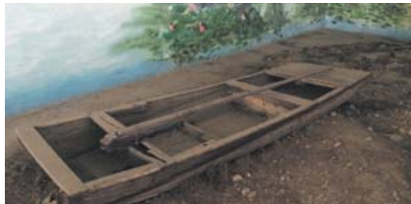
▲微山湖抗战“鸭枪队”当年使用的小船“枪溜子”。