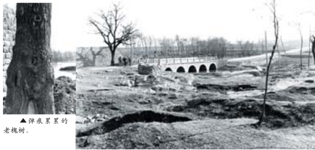
▲弹痕累累的老槐树。