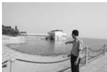
□宋学宝 李培政 报道 峡山水库是山东第一大水库，常年蓄水量为5.5亿立方米，但8月28日的蓄水量只有2.54亿立方米，不到正常蓄水量的一半，较历年同期少1.1亿立方米。

1996年至2003年我省曾连年大旱，每年受旱面积均超过3000万亩，之后经历了长达10年的丰水期，粮食生产取得“十一连增”。当前的旱情是偶然出现还是进入新的枯水周期的拐点，暂时仍难有定论。如果不树立底线思维，做好面对最坏局面的打算，很有可能丧失主动权，给粮食生产和农产品供给乃至整个经济社会发展带来难以估量的损失。