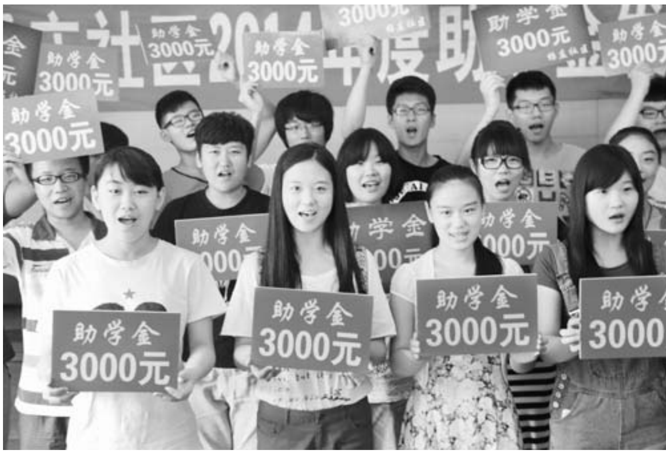
□记者 卢鹏 通讯员 殷云飞 报道 8月25日，济南市天桥区北园街道杨庄社区举办2014年度助学金发放仪式，对社区内31名今年考入大学的学生进行奖励，现场发放助学金共约10万元。

□徐永国 高文亮 报道 本报东营讯 日前，胜利油田为今年高考取得优异成绩的41名油田困难家庭子女和27名在读贫困大学生发放27.7万元“成就未来”助学金和励志奖学金。据悉，助学活动开展17年来，油田工会帮扶中心先后资助506名困难家庭子女走进大学校园，累计发放助学金1650余万元。