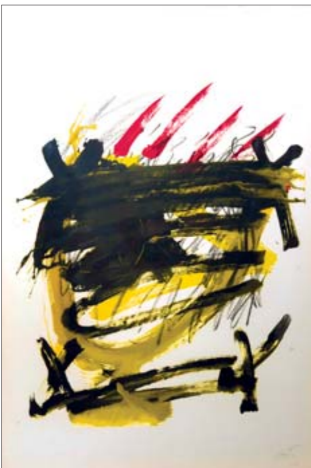
塔比艾斯石版画作品