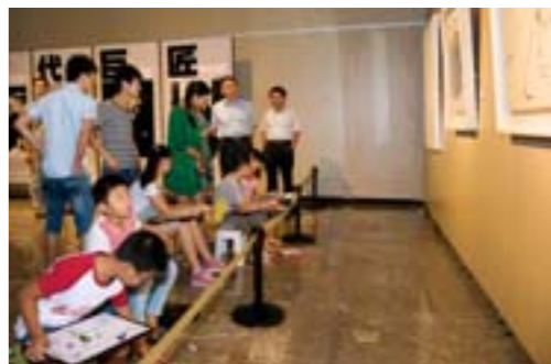
正值暑期，很多孩子来到济南市美术馆欣赏和临摹大师作品。