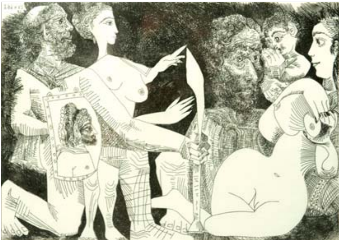
毕加索铜版画作品