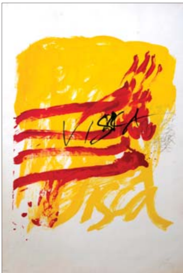
塔比艾斯石版画作品