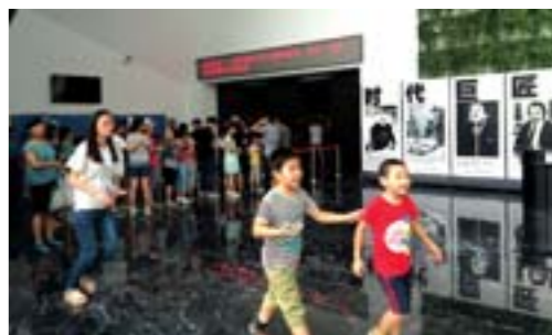
观众在展厅外排队进馆与“时代巨匠”近距离接触。