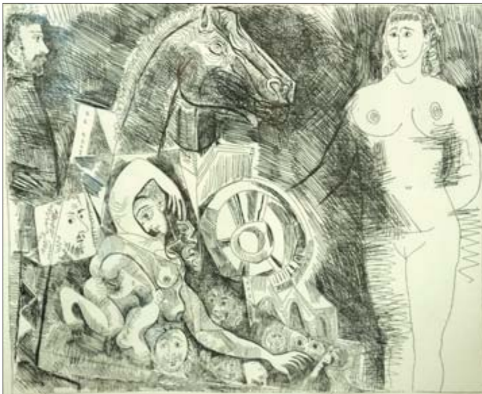
毕加索铜版画作品