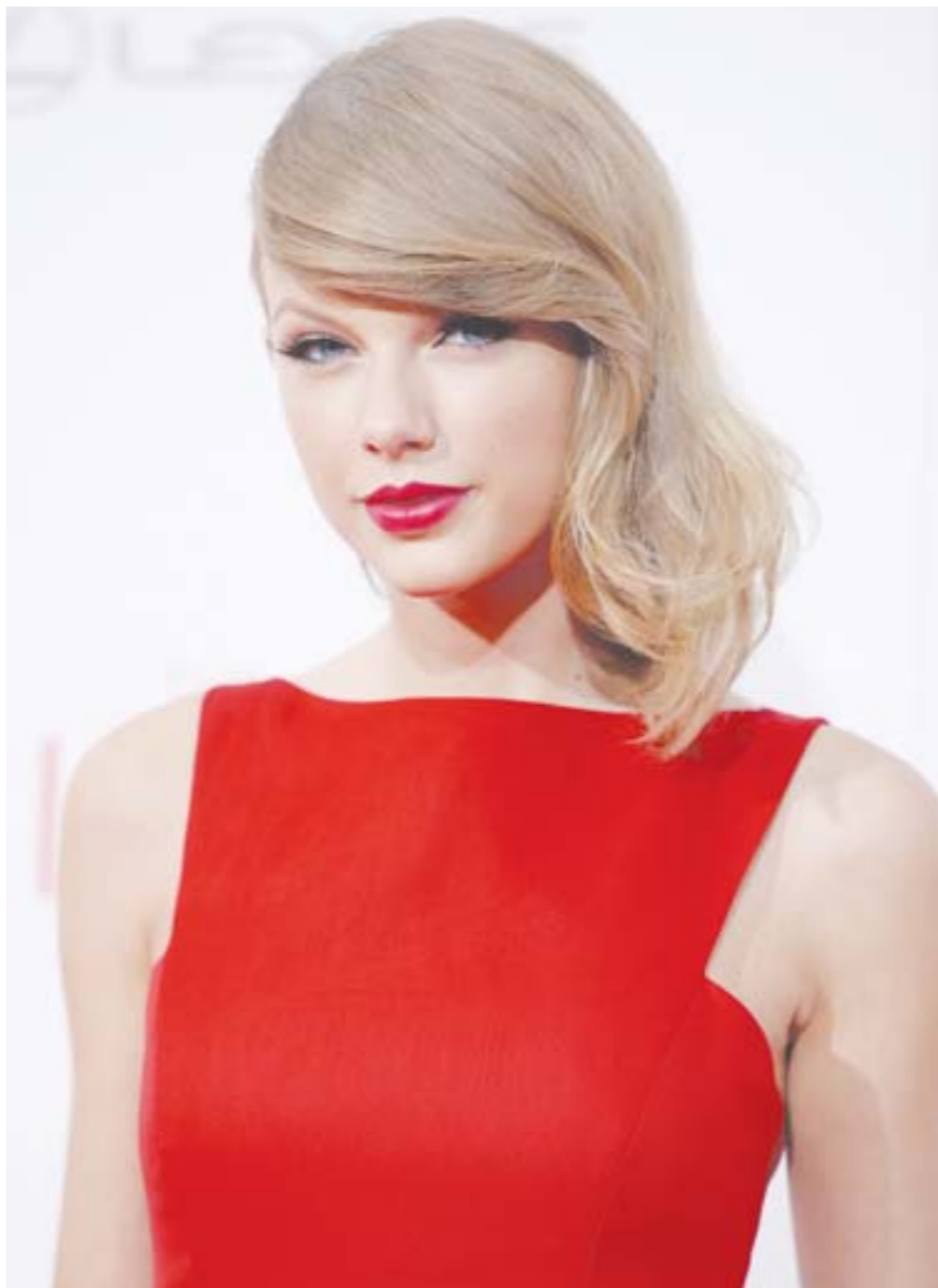
当地时间8月11日，女星泰勒·斯威夫特亮相电影《赐予者》纽约首映礼。

好的电视剧塑造的人物，是让人亲近的。无论塑造伟人，还是常人。马少骅这次演得不错，我准备继续看下去。