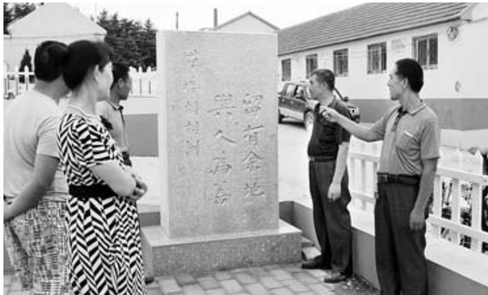
乳山市城区街道草埠村村民在观看评议“村训”。