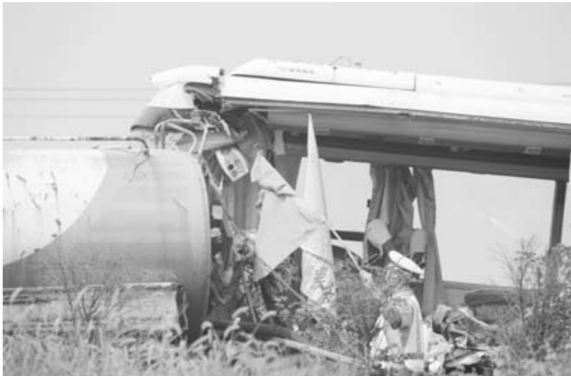
□信怀顺 报道 7月27日，青银高速淄博段两车追尾。事故现场，相关部门正在进行处理。