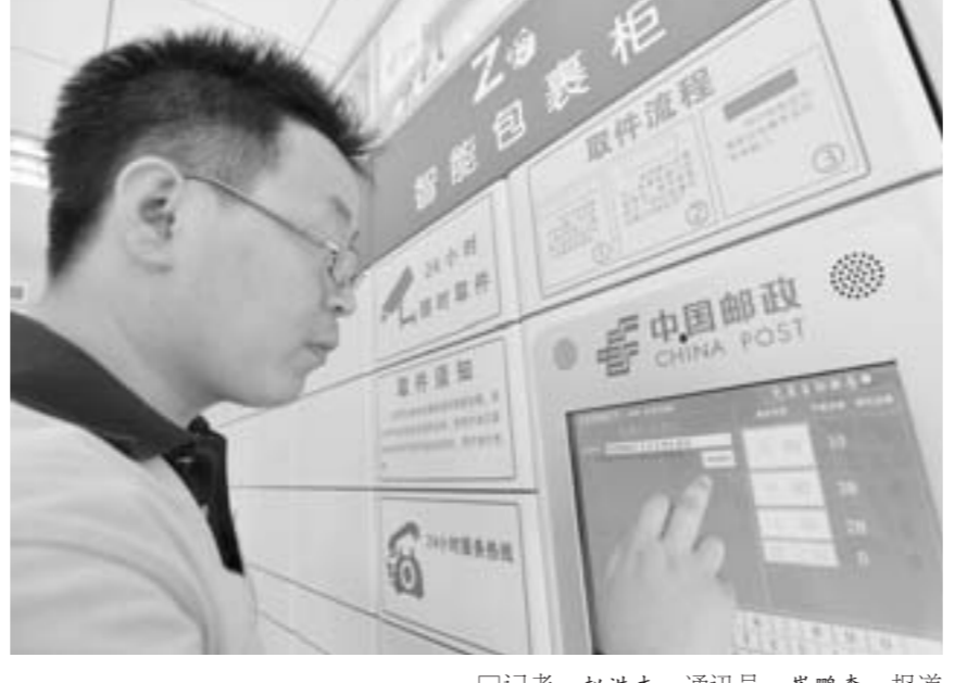
□记者 赵洪杰 通讯员 崔鹤森 报道 7月16日，邮局投递员使用智能包裹柜投递包裹。

据介绍，济南和平路社区易邮店、济南趵突泉易邮店也将于本周投入使用。到年底，山东邮政将在全省17个市地建成100个城市社区易邮店。