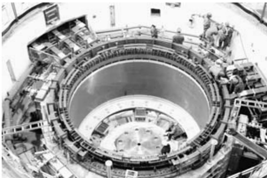
泰安抽水蓄能电站设备进行安装。

日前,国家出台了少政策,扶植生猪育种和地方品种。种猪企业的积极性也被调动起来,100家核心育种场已筛选出了74家,潍坊江海原种猪场在第二批入