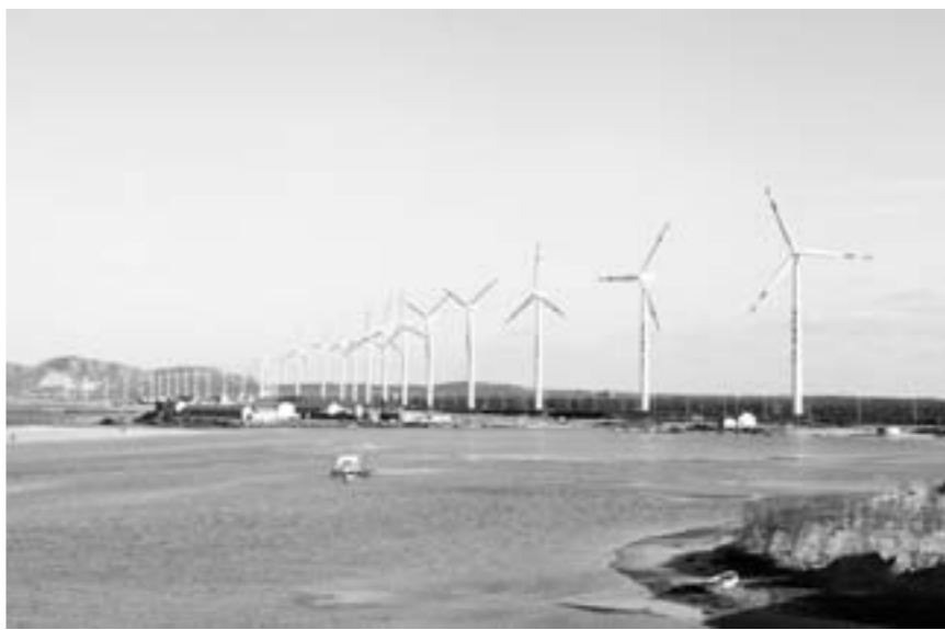
神华风电荣成风电场。