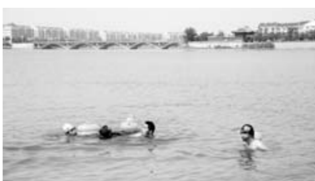
赵永斌报道 6月23日,高唐党员义务救援打捞队在进行水中救人技能训练。