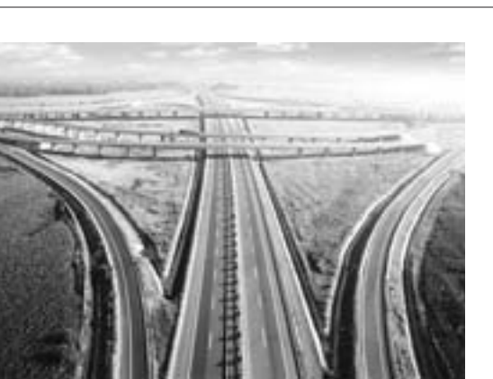
曲阜双立交互交鸟瞰。

济宁市在实现“村村通”“村内通”后将向“户户通”转变，已启动了美丽乡村建设三年行动计划，以道路建设带动生态文明乡村建设，三年内全面完成美丽乡村建设目标。