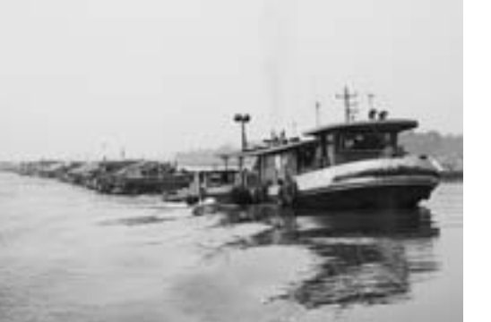
千吨级舰队行驶在京杭大运河三级航道上。