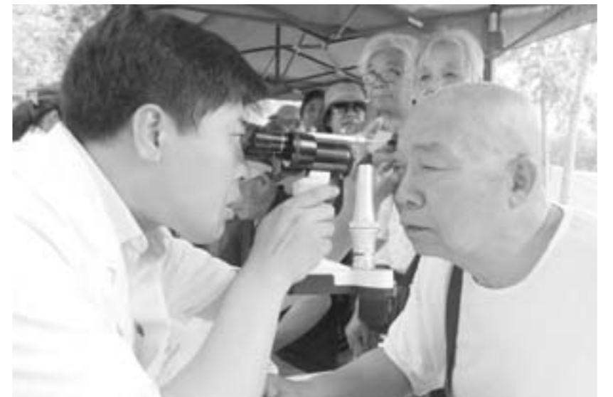
山东省眼科医院专家为市民义诊。