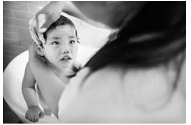
北京一家儿童福利机构内接受工作人员照料的孩子。救助专家认为,没有完整的家庭,孩子的心灵深处缺少亲情。他们渴望社会的爱,但更渴望亲生父母的爱。