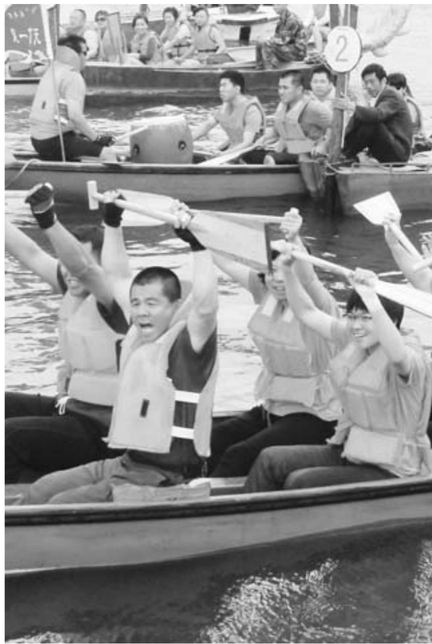
□记者 房贤刚 报道

据悉，随着麦收时节的到来，许多在外打工的务工人员开始陆续返乡准备麦收，麦客成为小长假最后一天的客流主角。济南长途汽车站工作人员介绍，省外的濮阳、商丘、范县等地以及省内的巨野、成武、曹县等鲁西南地区，都成为比较热门的“麦客线路”，预计麦客返乡客流还将持续到6月中旬。