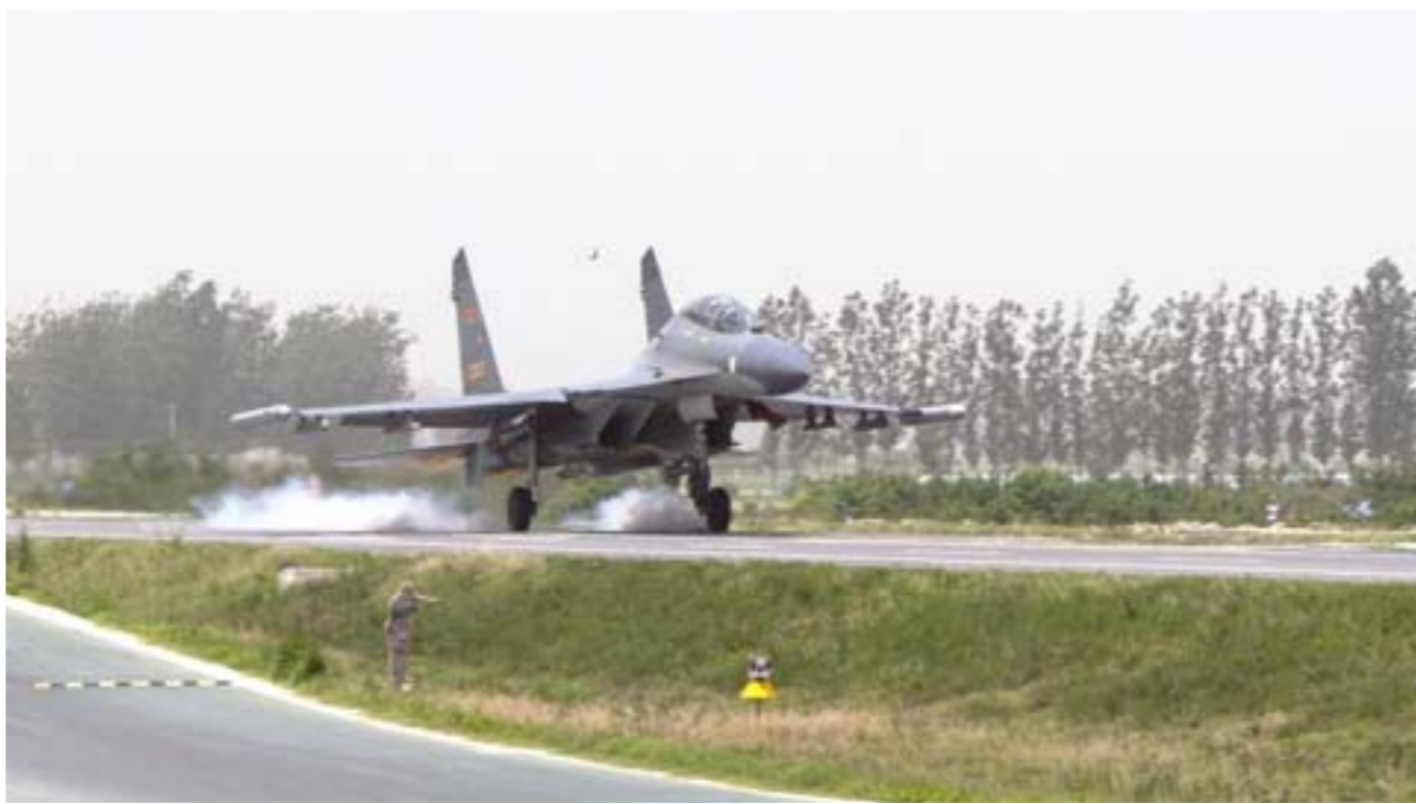
5月25日,济南空军在豫东地区首次组织了多机种高速公路飞机跑道试飞起降。图为我军三代战机着陆成功。

新华社郑州5月25日电 包括第三代战机在内的多种机型25日在郑民高速公路飞机跑道试飞,这在我军历史上还是首次。这次试飞活动进一步检验了跑道技术性能,并形成了高速公路飞机跑道实战化综合保障能力,为提高飞行部队平时战时备降应急能力和军地联合保障部队飞行的协同能力