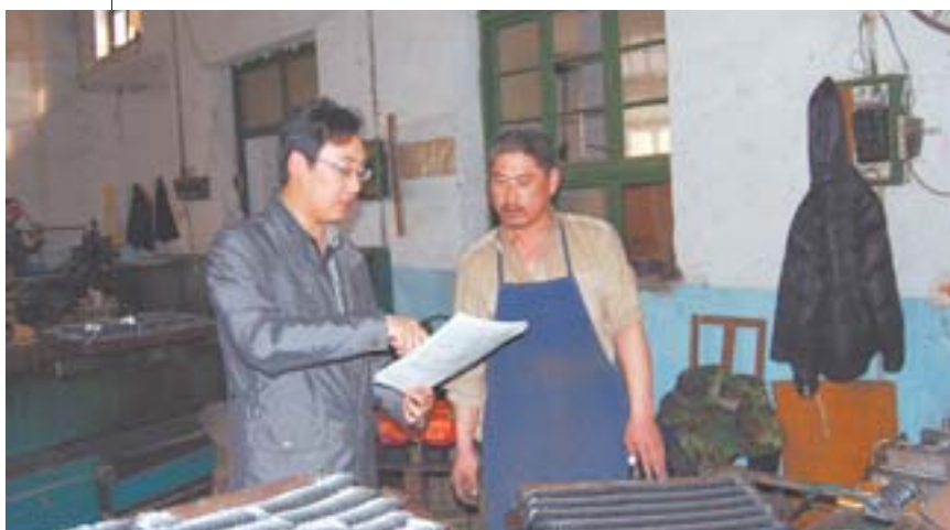
□褚亚楠 报道 蓬莱机关干部深入企业走访。