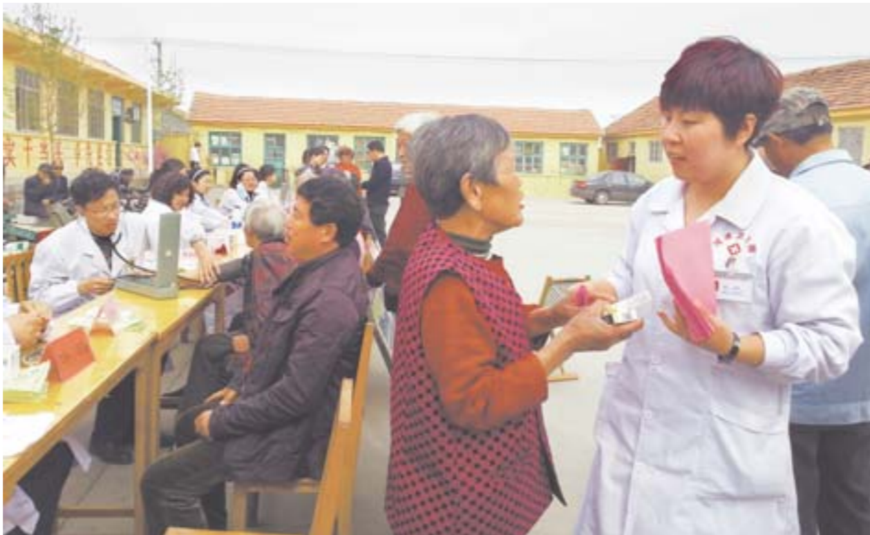
□于泉源 报道 4月11日,作为“送医下乡”活动的一部分,莱阳市中医院14名医生来到河洛镇马崖头村,为村民提供医疗服务。

◆今年3月份,在此前开展的“我爱我村”活动基础上,莱阳市重新挂牌,建立以驻村工作队为主体、医务人员参与的“3+1”驻村强基新模式,将城市医生纳入驻村队伍中,实行“一村一医”。这种长期化“送医下乡”工作机制的建立,实际上是对全市城乡医疗资源分布不平衡现状的一种统筹互补,同时也是该市践行党的群众路线的一次生动实践。