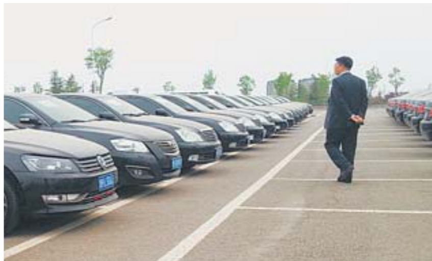
莱商银行所拍卖的公车。

从去年起,莱商银行派专人到其他金融机构学习借鉴外地车改经验,并经反复调研论证后着手车改,最终“清”出143辆车,这其中甚至有1辆