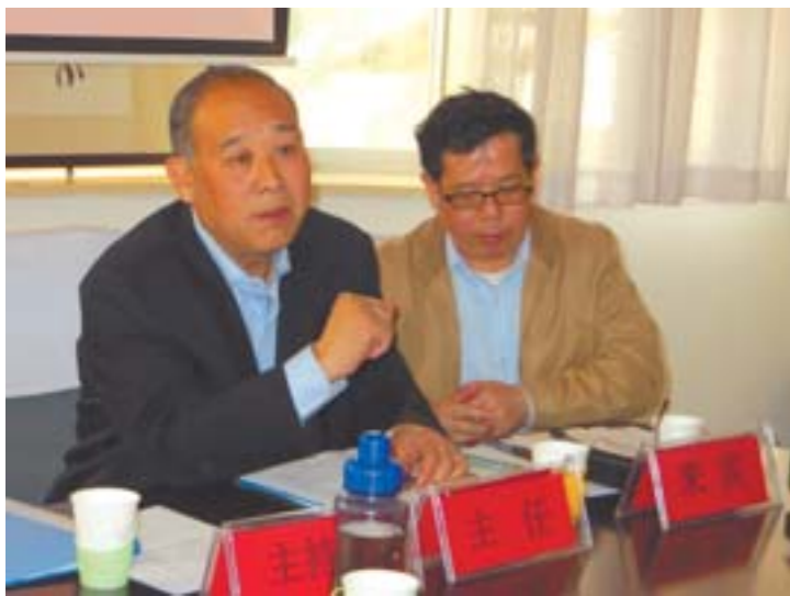
□记者 薄克国 报道 青岛市老年学学会 第三届理论研讨会现场。