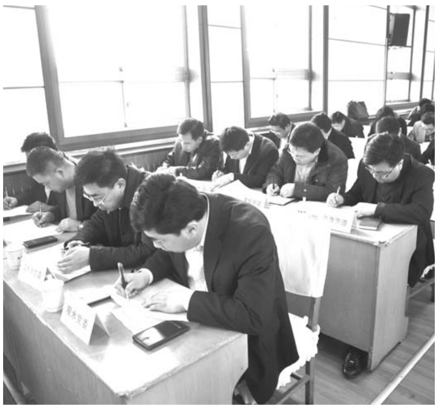
3月4日，牟平区106名部门负责人进行闭卷考试，检验群众路线教育活动的学习成果。

□记者 隋翔宇 通讯员 于俊彦 报道 本报烟台讯 3月4日上午，在牟平区党的群众路线教育实践活动动员大会召开现场，106名来自各镇街、各部门、各单位的主要负责人，参加了党的群众路线教育实践活动有关知识闭卷考试。考试意在检验“一把手”对开展教育实践活动的相关精神是否学得深、吃得透，以示示范带动全区学习教育环节出实效、不走样。