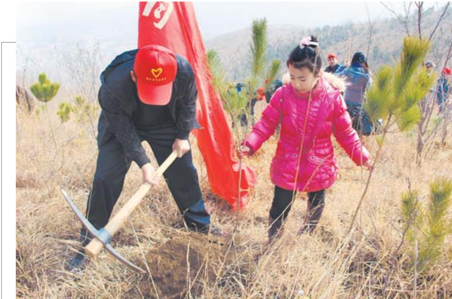
3月9日，由共青团烟台市委主办的“青春绿色行动·共建美丽烟台”青少年植树活动在福山区门楼镇举行。来自烟台30多个单位的500余名志愿者在两个小时中共种下2000株树苗。活动现场设置了多处垃圾回收箱和打火机存放处，以确保在植树活动中不留污染、不留火种。

济南大学泉城学院在济南大学、大众报业集团的合作下，于2011年迁址蓬莱。蓬莱地处山东半岛北部，濒临渤海、黄海，与辽东半岛及韩国、朝鲜、日本隔海相望，是国际知名的“世界七大葡萄海岸”之一和“国家历史文化名城”。区域环境为学院的教学、科研、就业、国际交流提供了广阔空间，此前学院在对登州会馆等人文课题研究方面已取得一定成绩。