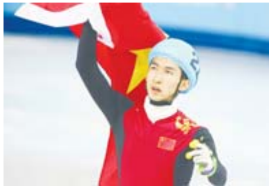
2月21日，武大靖在比赛后向观众致意。当日，在2014索契冬奥会短道速滑男子500米决赛中，中国选手武大靖以41秒516的成绩摘银。