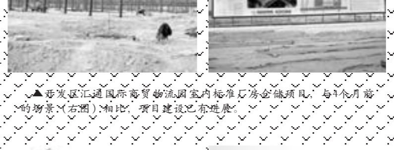
▲开发区汇通国际商贸物流园室内标准厂房仓储项目，与4个月前的情景(右图)相比，项目建设已有进展。

新型有色金属合金材料项目已取得168亩的土地指标，一号车间主体已经完成，三号车间基础施工即将完毕，预计年底前三号车间能够完成施工建设。 记者一行随后来到燕山路以东，牡丹江路以南的博创注塑机械项目现场。由于天气原因，工厂已处于停工状态，只有几名看护工人在工地打点零活。据项目负责人介绍，该项目地面基础垫层完成近一半，杆探完成一部分，绑扎基础钢筋正在进行，施工进度并没有完全达到施工计划。 在位于经济开发区高速出口8000米附近的汇通国际商贸物流园室内标准厂房仓储项目现场，记者看到，这里已没有施工人员。门岗的保安告诉记者，由于天气很冷，半个月前这里已经停止了施工。开发区宣传办相关人员说，二期汇通商贸物流园室内标准厂房仓储项目，已经完成了33处院落、1.3万平方米的全部征迁任务，12万平方米钢结构立柱桩基以及钢结构主体框架全部完成，现在正在安装钢结构墙彩板，按进度年底完成建设任务。据记者现场询问，按计划全部完成的难度较大。