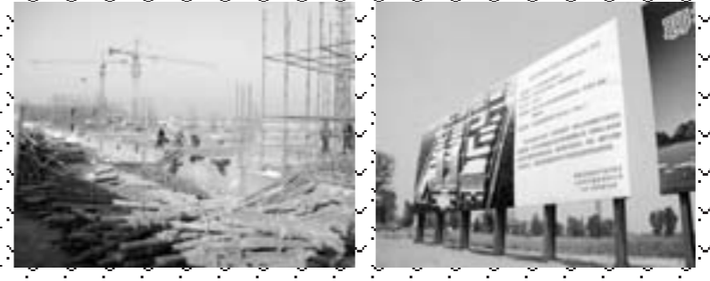
▲在冠县冠星集团扩能完善提升工程项目车间内，生产设备已经就位。右图为4个月前空荡的车间现场。