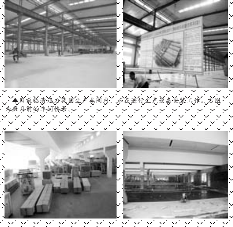
▲目前临清通力集团生产车间内，正在进行生产设备安装工作。右图为数月前的车间情景。

正在调试，电缆正在入地。如果按照目前的进度，1月份这个新建的厂房就能投入生产，年生产能力2万辆。”主管生产的一名负责人说。 中色奥博特是一家铜加工企业，主要生产高精度空调制冷铜管、高精度铜合金板带和高精度压延铜箔产品。据了解，8月份项目观摩时2万吨压延铜箔项目所在地仍然是一片空地，到12月份，厂房已进入封顶阶段，十余名工人正在操作吊车进行封顶作业。 在华兴纺织厂的3万平方米的新纺纱车间内，来自德国和瑞士的顶级纺纱设备正在运行，只有少数几个工人在车间内忙碌着。据华兴纺织有限公司的一名相关负责人介绍，新生产车间是12纱锭的产能，目前已经投产了8万纱锭，还有新设备正在调试。由于来自厂家的技术工人人手有限，还有三分之一的新设备正在安装调试，8万纱锭的生产线已经运转了1个月，工人实行三班倒，其余的新设备在本月底就能投产。华兴纺织有限公司之前的生产能力是30万纱锭，新厂房全部投产后，将达到42万纱锭的生产能力。