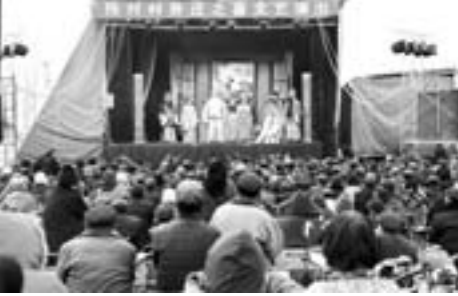
□冯长禄 报道 近日，在平阳县平镇新建陈村社区回迁的120户居民，免费看了七天“大戏”。陈村村会春启动社区建设，在干部群众共同努力下实现当年回迁。新社区内道路整洁，绿化配套、水电暖设施齐全，村民直说“好”。

□王兆锋 报道 本报聊城讯 12月23日，记者从聊城市市长办公会上获悉，为开发建设南部新城，聊城市筹建了聊城市新城投资发展有限公司，目前已正式运营。 公司成立后，结合江北水城旅游度假区总体规划进展情况，加快推进城建融资。确定以陈屯片区土地综合整治项目为载体，向建行申请项目贷款8亿元，近期就能签订贷款合同。浙商基金股权投资项目进展迅速，前期基础材料准备完毕，正在进行全方位的对接，力求春节前股权投资5亿元到位。同时，加快推进了工商行棚户区改造项目和华夏银行土地综合整治项目贷款。