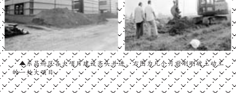
▲东昌府区内各项目建设齐头并进，右图为几个月前刚刚破土动工的一处大项目。