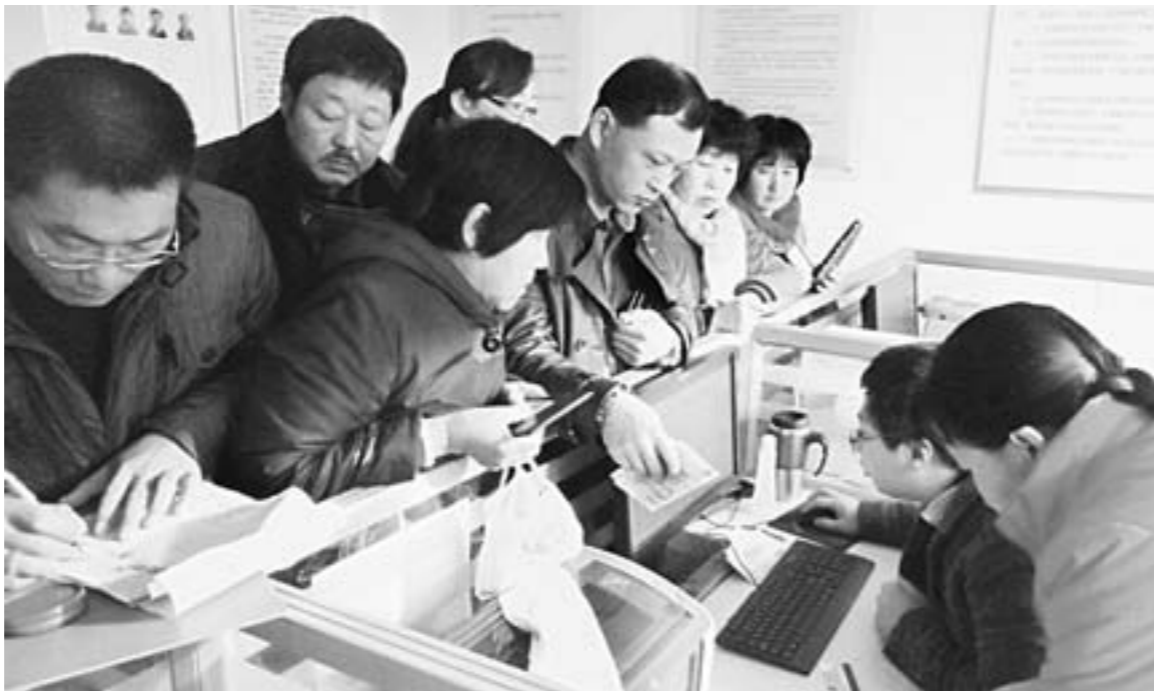
12月16日，乳山向阳社区居民在集中缴费办理居民医保。 □彭辉 徐高 报道

截至今年8月末，全省(不含东营市)居民医保和新农合参保人数分别为1007.73万人和6326万人，覆盖面分别为94.85%和99.88%。东营市城乡居民医保参保人数为129.62万人，覆盖率为99.95%。居民医保基金累计结余38.39亿元(不含东营市2012年末居民医保基金结余1.66亿元)新农合基金累计结余98.15亿元(不含东营市2012年末新农合基金结余0.64亿元)。